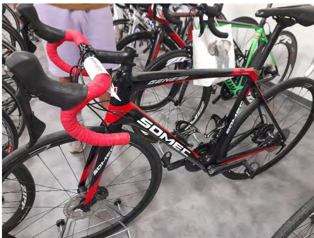
Foto di alcune biciclette acquistate.