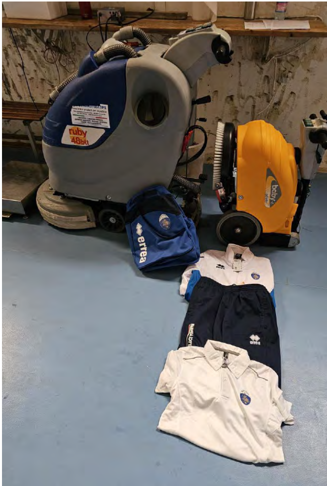
Foto esemplificative di parte del materiale acquistato.